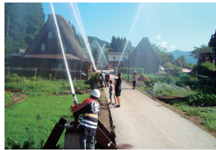
放水訓練（世界遺産 合掌造り）