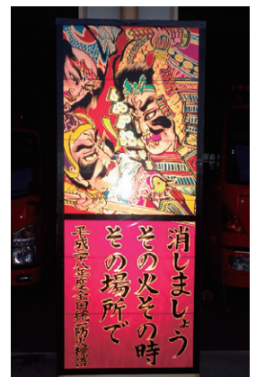
防火広報（津沢あんどん）

また、火災予防運動期間中以外にも、小矢部市津沢で、6月に実施される津沢夜高あんどん祭に、防火行燈を作成し消防庁舎前に展示したり、南砺市福光で、7月に実施されるなんと福光ねつおくり七夕祭り期間中に、市内保育園児にそれぞれ願いを込めた短冊を書いてもらい防火七夕に飾るなどして、管内市民へのPR活動を実施しています。