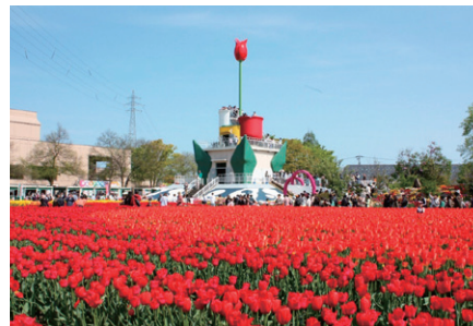
となみチューリップフェア