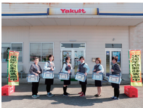
防火広報（ヤクルトレディー出発）