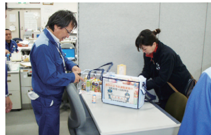
防火広報（ヤクルトレディー事業所訪問1）