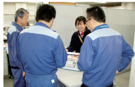
防火広報（ヤクルトレディー事業所訪問2）