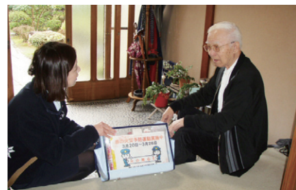
防火広報（ヤクルトレディー個人宅訪問1）